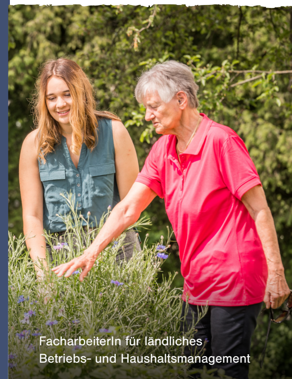
FacharbeiterIn für ländliches Betriebs- und Haushaltsmanagement